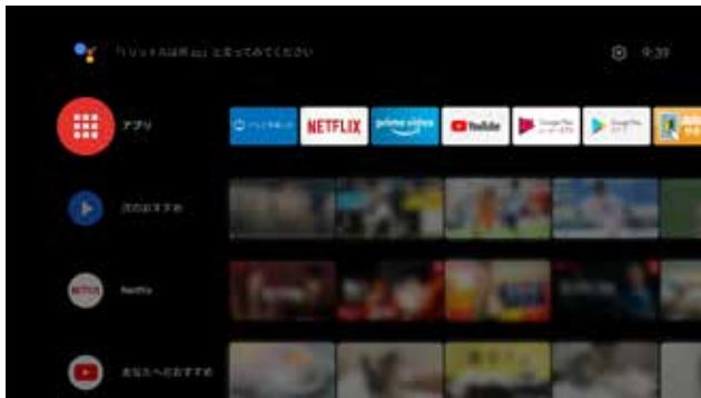
①AndroidTV ホームの「アプリ」を選択し決定ボタン押下