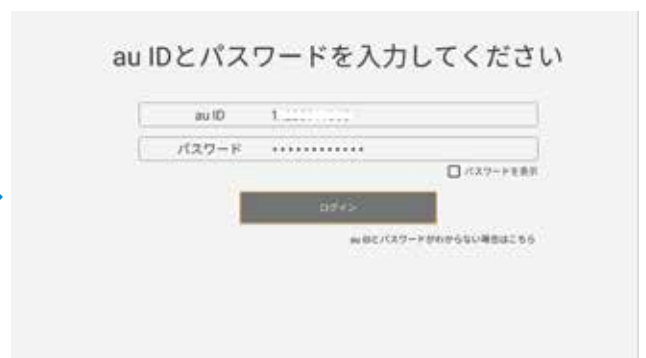
⑧「ログイン」を選択し決定ボタンを押下