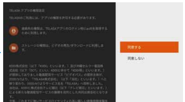
④権限設定確認画面で「同意する」を選択し決定ボタン押下 (初回起動時のみ表示)

ケーブルプラス STB-2 申込時にお客様へ送付される au ID およびパスワードでログイン