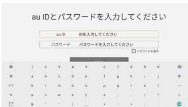
⑦au ID とパスワードをそれぞれ入力