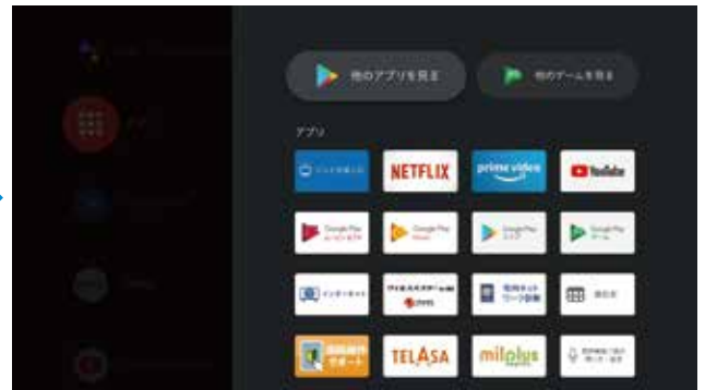
②アプリ一覧の中から「TELASA」を選択し決定ボタン押下