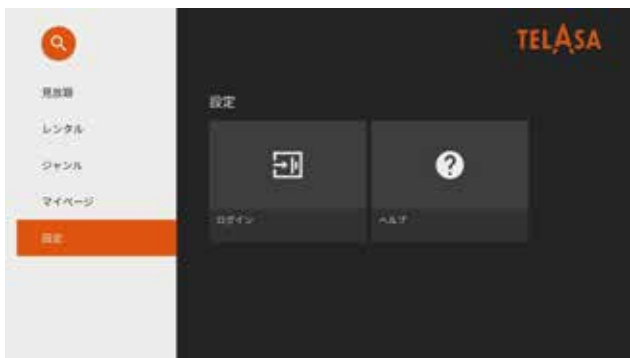
⑤TELASA 画面で「設定」を選択し決定ボタンを押下

ケーブルプラス STB-2 申込時にお客様へ送付される au ID およびパスワードでログイン