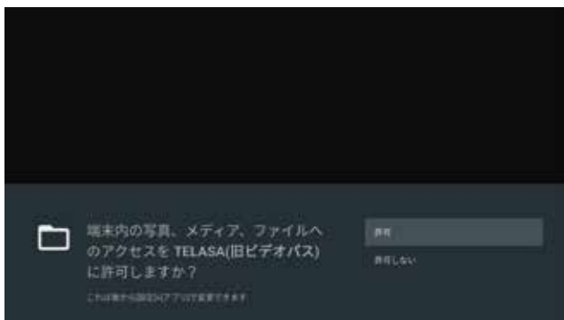
③アクセス許可確認画面で「許可」を選択し決定ボタン押下 (初回起動時のみ表示)